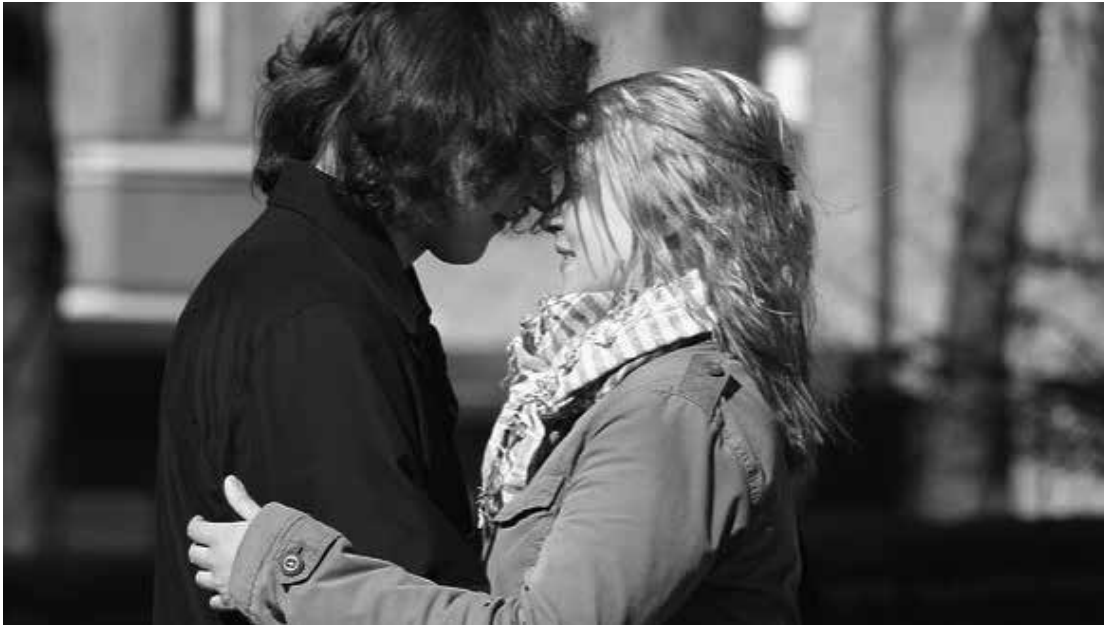
Rakkaussiirtolaisten määrä on kasvanut niin Suomessa kuin maailmallakin